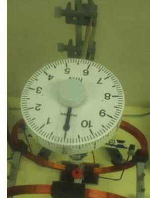
Slika 1. Mjerni uređaj; desno: pogled odozgo na skalu torzijskog dinamometra