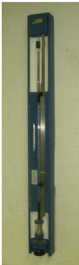
Slika 2. Barometar

Volumen plina u cijevi jednak je umnošku visine stupca plina l , koja se očitava sa skale, i površine presjeka cijevi S = 1.02 \cdot 10^{-4} \text{ m}^2 , kojem pribrajamo volumen dijela cijevi obojenog smeđe \Delta V = 1.01 \text{ ml} . Tlak plina u cijevi jednak je zbroju atmosferskog tlaka p_a i tlaka stupca žive \Delta p = \Delta h \cdot 0.1333 \text{ kP mm}^{-1} , \Delta h = h_1 - h_2 je razlika razina žive u rezervoaru i u cijevi.