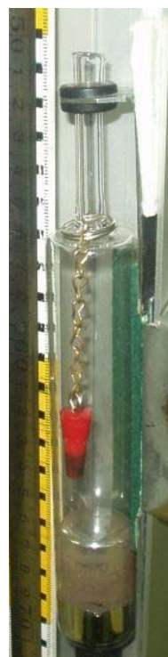
Slika 3. Gumeni čep